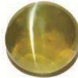
1 CAT EYE STONE