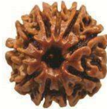
10 MUKHI RUDRAKSHA