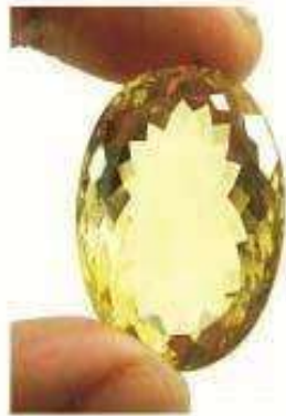
1 SUNELA STONE