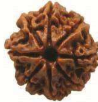
8 MUKHI RUDRAKSHA