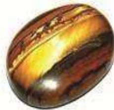
1 TIGER STONE