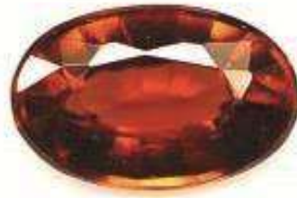
1 GOMED STONE