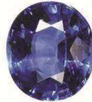
1 NILI STONE