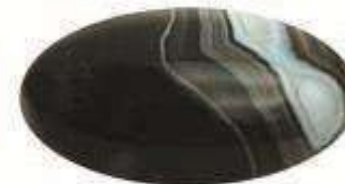
1 HAKIK STONE