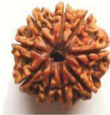
9 MUKHI RUDRAKSHA