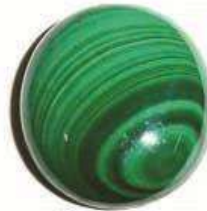
1 KIDNEY STONE